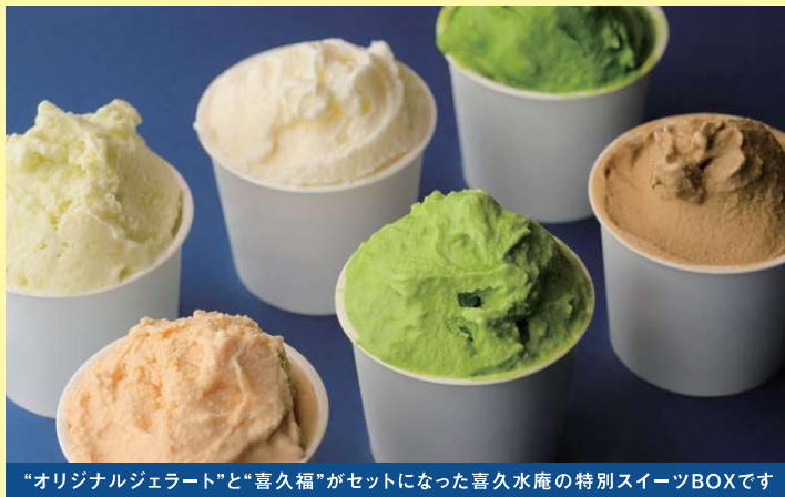
“オリジナルジェラート”と“喜久福”がセットになった喜久水庵の特別スイーツBOXです